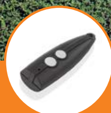
Coppia di Trasmettitori rolling-code bicanale Venus.

Pair of Venus two-channel rolling code transmitter.