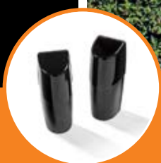
Coppia di fotocellule da parete Argo.