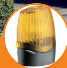
Lampeggiante a Led Pegasus.

Pair of Venus two-channel rolling code transmitter.